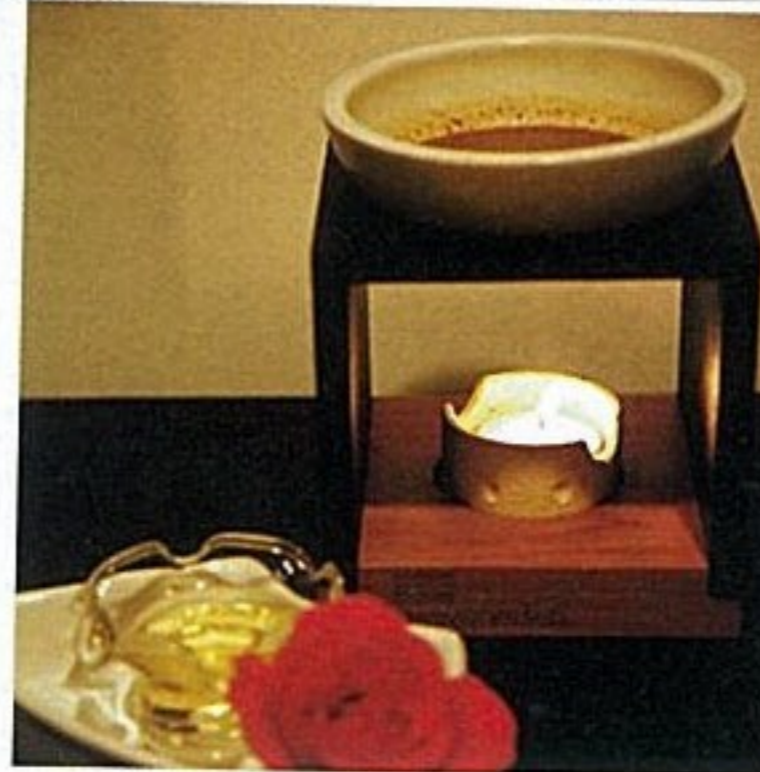
把按摩油加熱可加速血液循環。

以人參當歸加蓮花精華混合按摩油， 可加速血液循環。 90分鐘2510Baht/HK$534